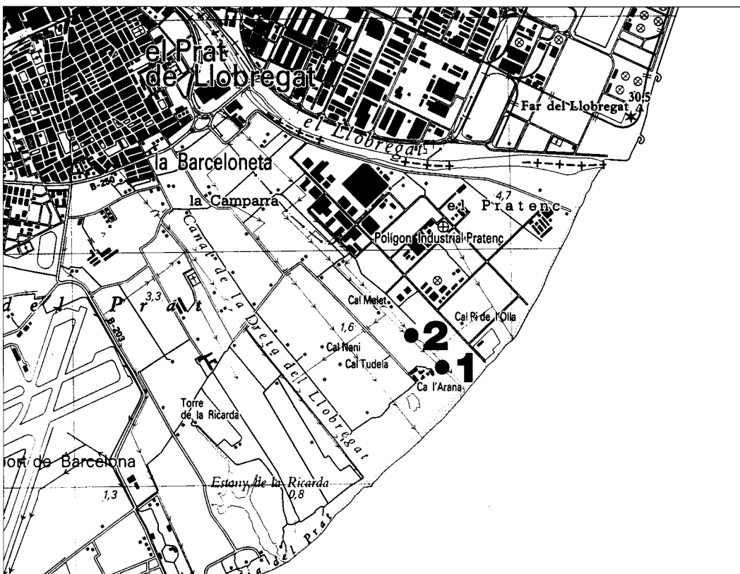
Mapa 1. Localització dels dos punts de mostratge (canal Rc-58 sèquia inferior del canal de la dreta del Llobregat, paratge de ca l'Arana, terme municipal del Prat de Llobregat, quadrícula UTM DF2773).

Frequency: * (very rare), 1 (rare), 2 (uncommon), 3 (frequent) and 4 (very common).